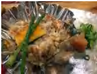
しらこの銀カップ焼き